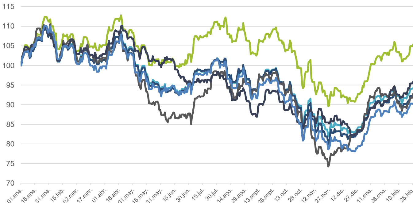
Desempeño Índices MILA S&P 2019 (base 100)