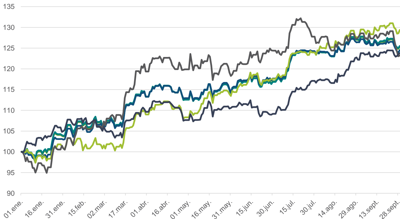
Desempeño Índices MILA S&P 2017 (base 100)